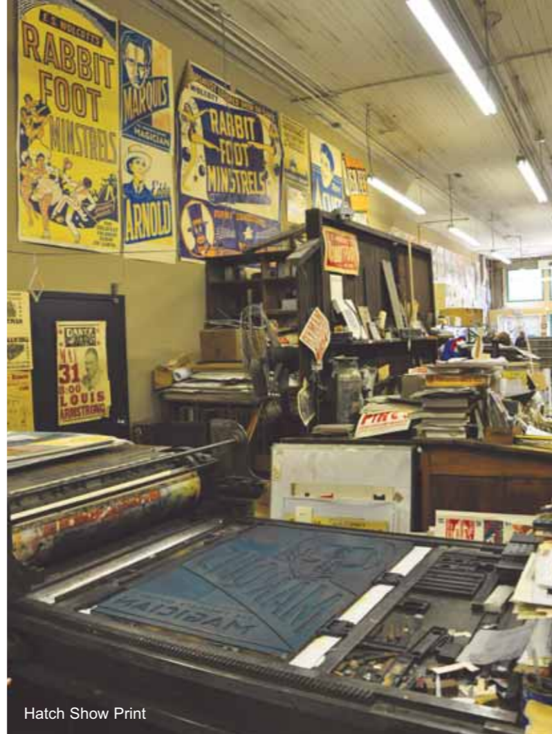
Hatch Show Print