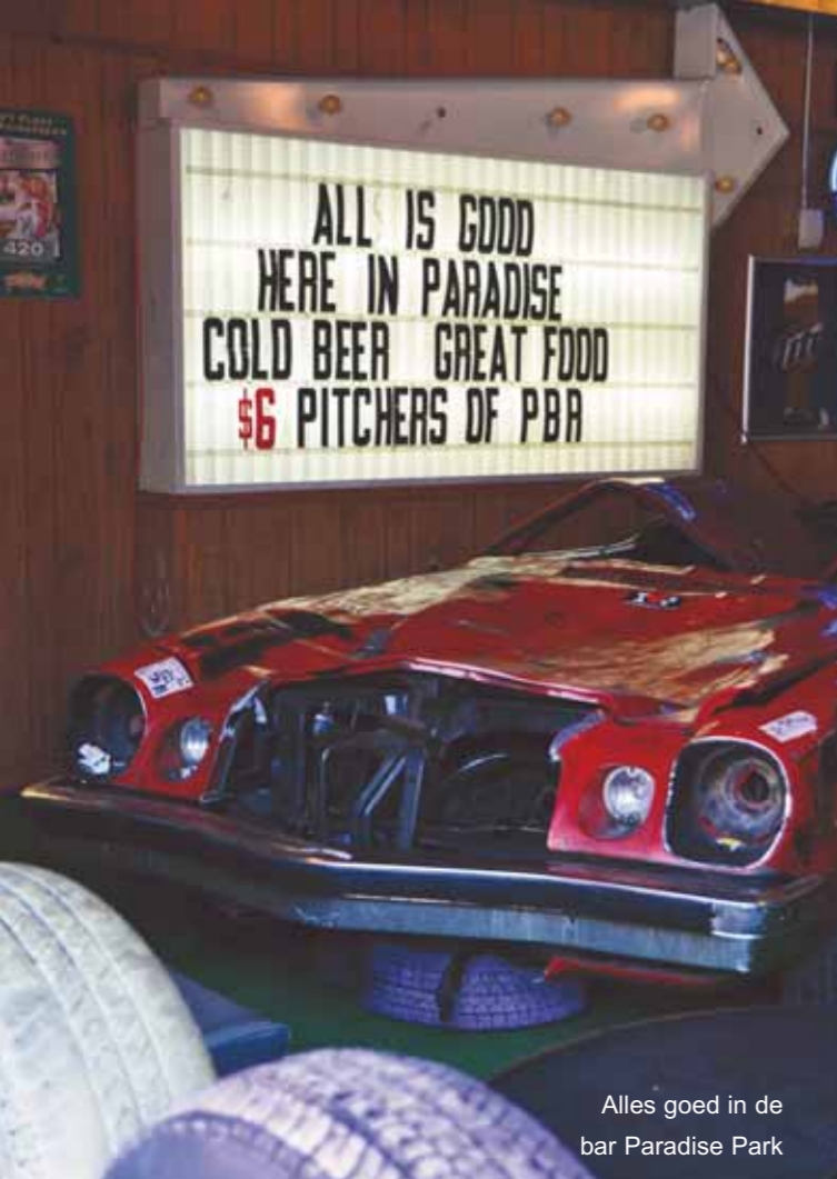
Alles goed in de bar Paradise Park