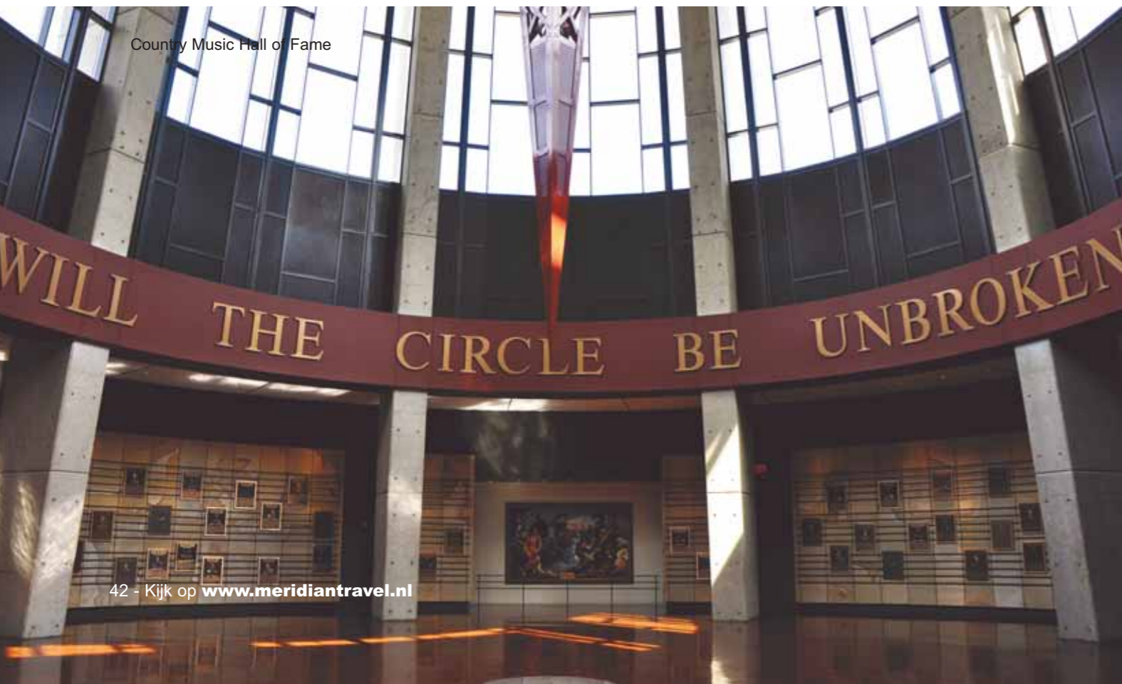
Country Music Hall of Fame

houtsnijwerk tot kunst verheven. Geen poster is hetzelfde, maar is tegelijkertijd onmiddellijk herkenbaar aan de blokletters en sjablonen die al meer dan 130 jaar worden gebruikt. Over legendarisch gesproken.